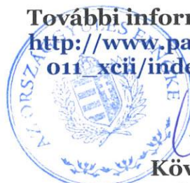
Kövér László az Országgyűlés elnöke

További információ a programról: http://www.parlament.hu/aktual/2011_xcii/index1/bundestag_info