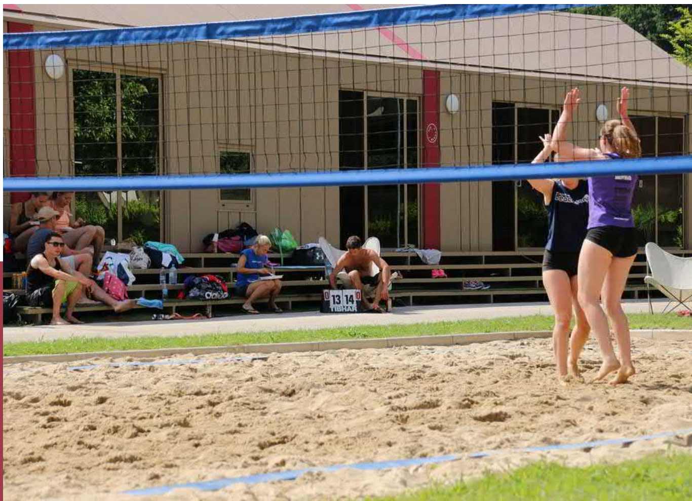
Röblabda bajnokság az üdülőhelyen