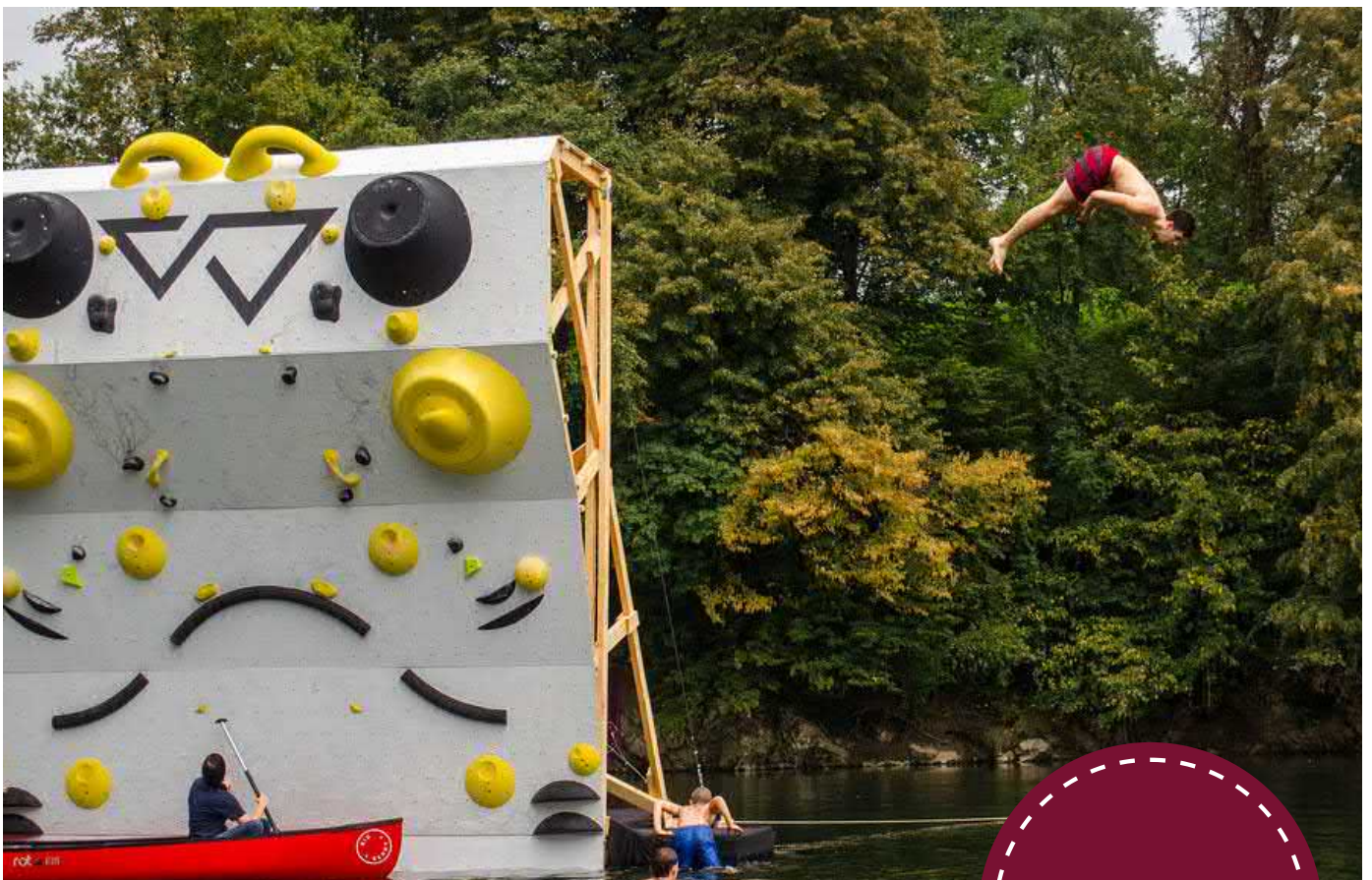
Gravity Challenge mászó fal, BIG BERRY

A legfontosabb, hogy fejlődtem. Egy kicsit mint szakember, és mint személy. Új helyzetekben találtam magam, új emberekkel, új helyeken, új információkkal elhalmozva, és új készségek elsajátításával töltöttem az időm. Mindezek az új ingerek segítenek új módon gondolkodni, és megdolgoztatják az agyat, mely így több kapcsolatot kell kialakítson a sejtjei között. Úgy gondolom ezen a nyáron jól tápláltam az enyémet. Függetlenül attól, hogy szakmai pályafutásom során előrehaladtam-e vagy sem, remélem, hogy általánosságban okosabb lettem - legalább egy hangyányival - mint a szakmai gyakorlat előtt. Ez volt az én elsődleges célom, fő motivációm. Az új tapasztalatok és az új élmények melyekkel gazdagodtam mentális növekedést, bölcsességet és örömet hoznak.