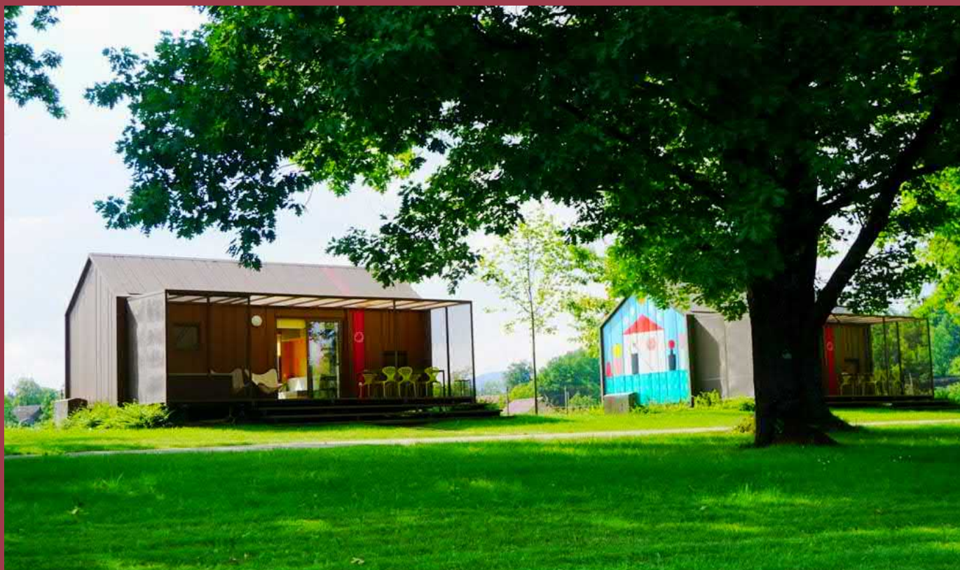
BIG BERRY - Kolpa River Resort üdülő

A BIG BERRY Kolpa egy üdülőhely, mely 7 mobil házból és egy irodaházból áll. Egy ház bérleti díja kb. 190 € / éj, reggelivel együtt. Az üdülő 36 vendég férőhellyel rendelkezik. A cég többet kínál, mint szállás. Üdülési élményt kínálnak, ahol a vendégek könnyen beilleszkedhetnek a helyi életstílusba és közösségbe. A BIG BERRY segítségével 40 partnerrel, például helyi élelmiszergyártókkal, helyi gyártókkal, éttermekkel, múzeumokkal, szolgáltatásokkal, turisztikai helyszínekkel léphetnek kapcsolatba. Vannak helyszíni szabadidős lehetőségek is, mint a kenuzás, röplabdázás, tollaslabdázás, szabadtéri kondi, kerékpárkölsönzés, sup bérlés, úszás, slack-lineozás, pihenés a szabadtéri ágyakon, és grillezés. A vendégek szervezett rendezvényeken vehetnek részt, mint például túrák, partnerek látogatása, BBQ-ebéd és vezetett sporttevékenységek. Jógaórákat, reggeli tornát és esti edzést kínálnak a szabadban. Specialitásuk az úgynevezett "Mastermind" esemény, ahol hetente meghívják ügyes szakembereket, hogy előadást tartsanak saját témájukról. Egy másik projekt a BB Chef, ahol ambiciózus szakácsokat hívnak meg, hogy elkészítsék a legjobb 3-fogásos menüjüket a helyszínen. Az üdülőnek ez volt a 3. szezonja a megnyitás óta, így még felfutóban van.