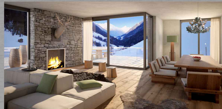
Jobbra: Schooren des Alpes luxus társasház képei