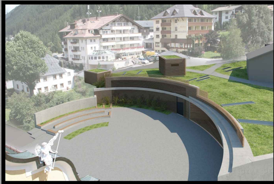
Balra: St. Nikolaus Kulturzentrum épületének pályázati képe a valós helyszínbe illesztve