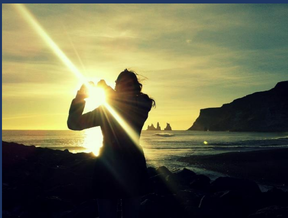
Vík- fekete homokos strand