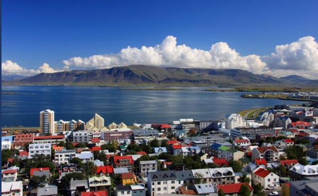
Reykjavík a Pearl kilátóból