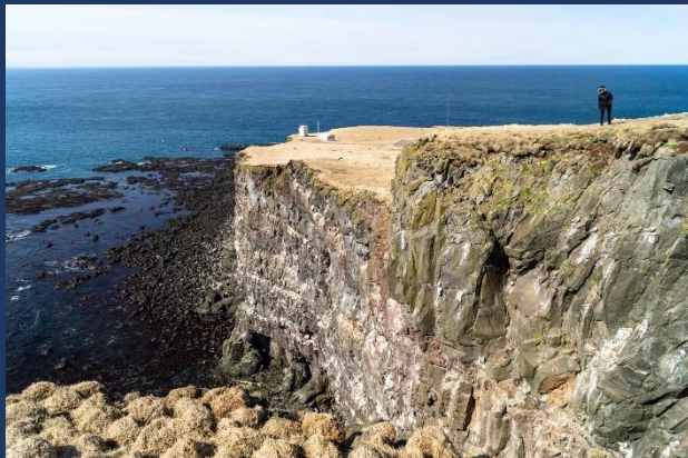
Látrabjarg- Európa legnyugatibb pontja 440 méter Magasan